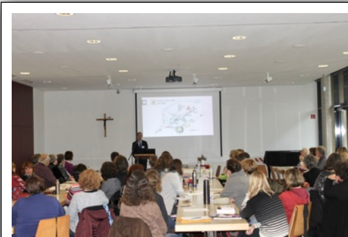
Der Hauptvortrag am Vormittag